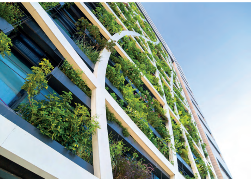
Illustration non contractuelle ne constituant pas un engagement quant aux futures acquisitions de la SCPI.